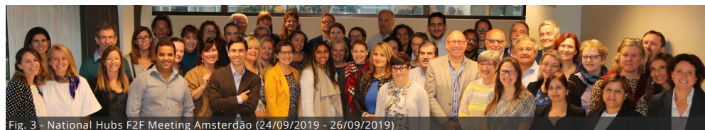
Fig. 3 - National Hubs F2F Meeting Amsterdão (24/09/2019 - 26/09/2019)