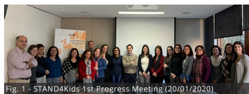
Fig. 1 - STAND4Kids 1st Progress Meeting (20/01/2020)

Pode saber mais sobre as reuniões em que o STAND4Kids marcou presença no nosso website: http://stand4kids.pt .