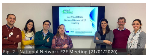
Fig. 2 - National Network F2F Meeting (21/01/2020)